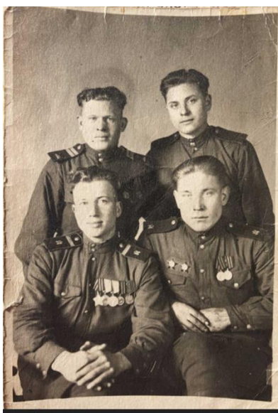
Мой прадедушка в верхнем ряду слева со своими боевыми товарищами в Германии в 1947 году