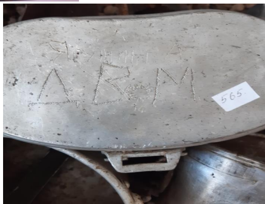
Солдатские котелки, представленные на витринах музея «Память сердца» лица №34